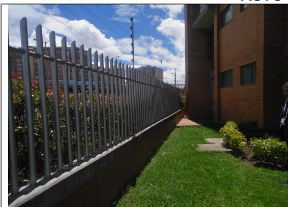
Fotografía 3. Conjunto residencial Panorama Park costado nor- oriental