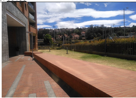
Fotografía 4. Conjunto residencial Panorama Park costado nor- occidental