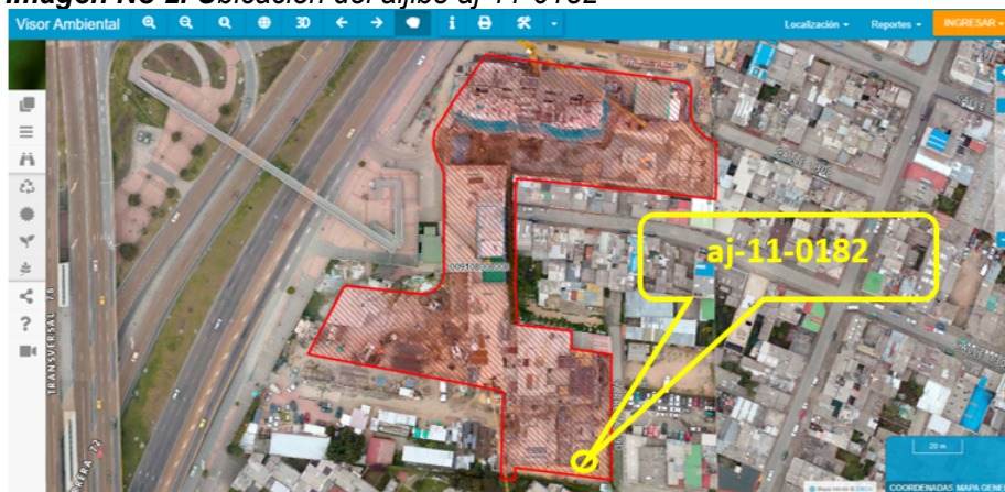
Imagen No 2. Ubicación del aljibe aj-11-0182

Mediante la herramienta Visor Ambiental se identifica que el aljibe aj-11-0182, NO se encuentra afectado por zona de manejo y preservación ambiental, corredor ecológico, ni ronda hídrica, según lo establecido en el Decreto 190 de 2004, modificado por la Resolución 228 de 2015 en la cual se precisa el límite del perímetro urbano y se dictan otras disposiciones.