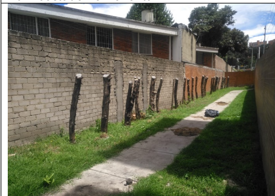
Fotografía 5. Conjunto residencial Panorama Park costado sur- oriental