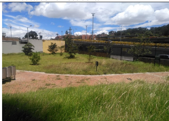
Fotografía 6. Conjunto residencial Panorama Park costado sur- occidental